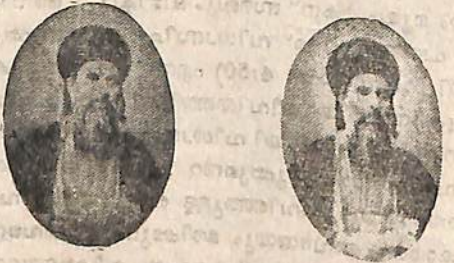
ഡബ്ബി ആൻഡ് അനിയൻ, പാറ്റനം.